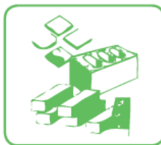
TUILES / BRIQUES