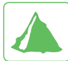
TERRE / DÉBLAIS